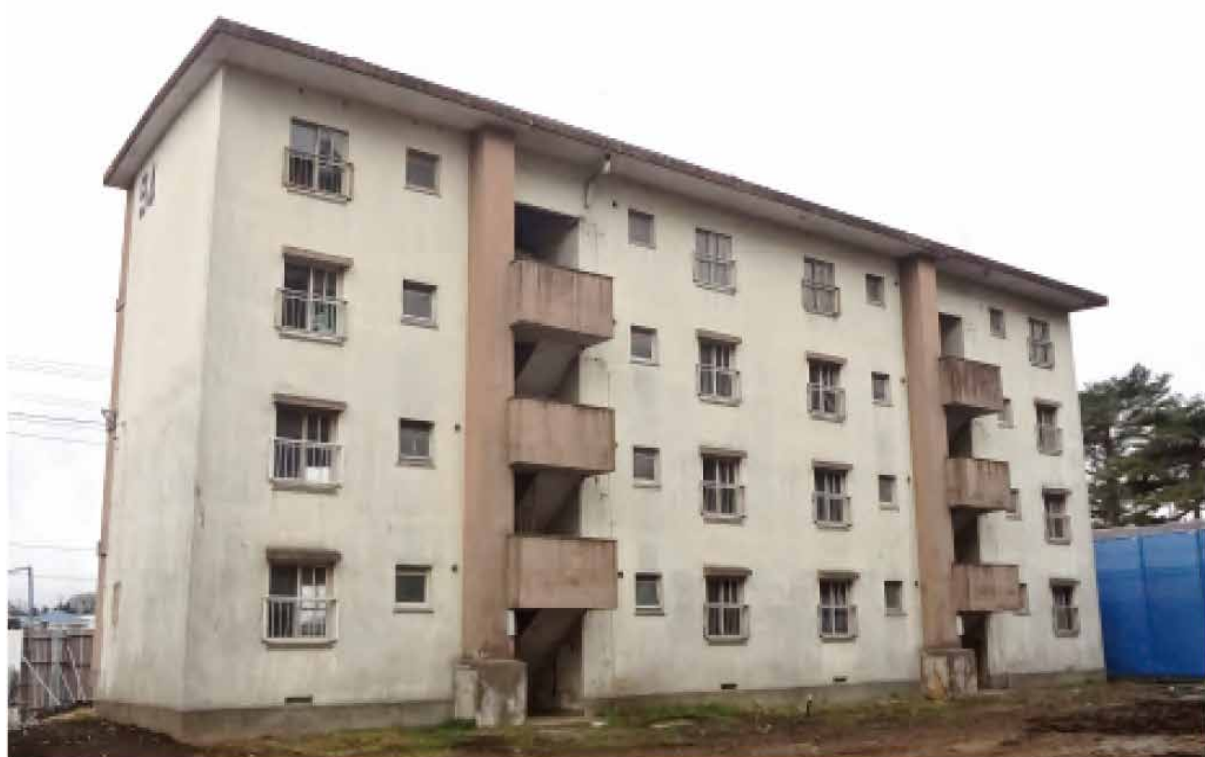
サービス付高齢者向け住宅改修前 建物外観