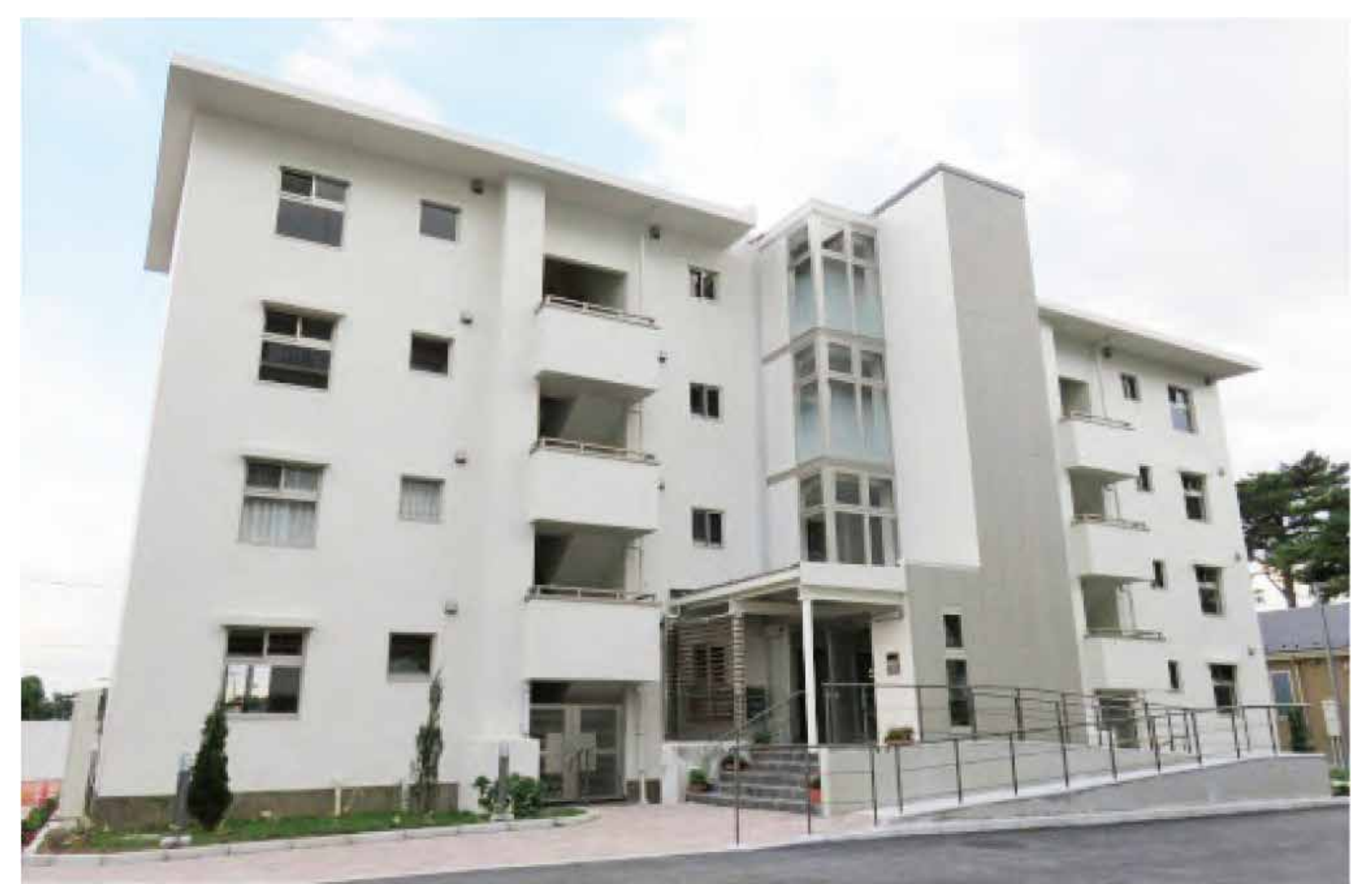
サービス付高齢者向け住宅改修後 建物外観